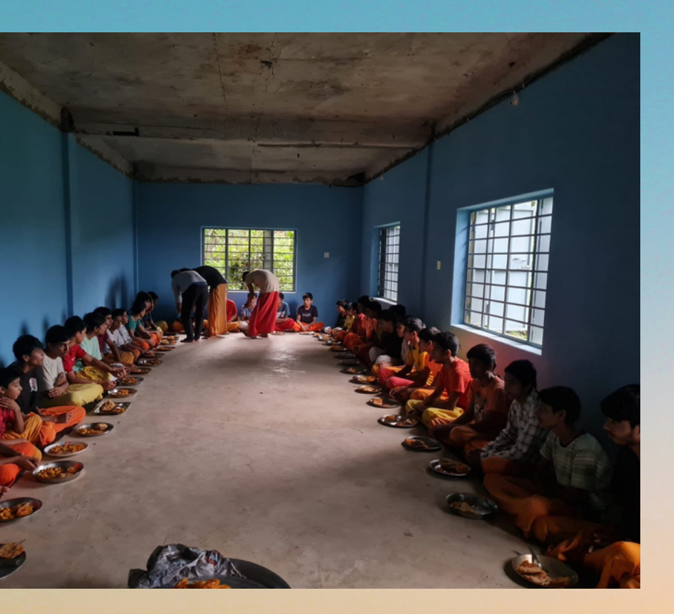
Lunch provided for 15 days

In collaboration with Chingari Shakti Foundation & RC Biratnagar distributing food to Devotees